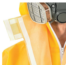
Patta coprimento autoadesiva