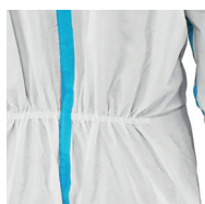
Elastico in vita