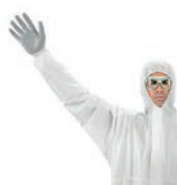
Maximaler Komfort und optimale Ergonomie