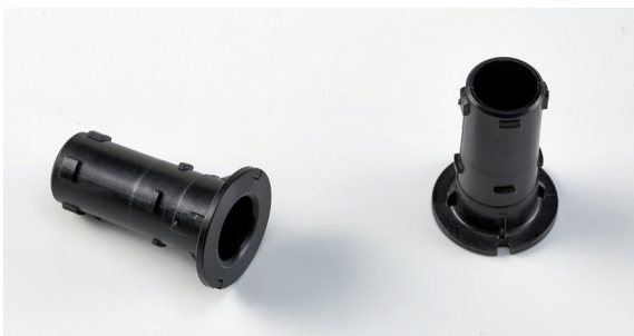
Elemento di supporto per specchietto retrovisore.

The evolved calculation approach and polymers with 'special' features make up the winning match to successfully replace metals".